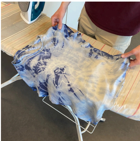
SHIBORI - JAPAN

Im Textillehreunterricht der Sek I wird kreativ gestaltet, genäht, gedruckt und experimentiert – von klassischen Techniken bis zu modernen Designmethoden.