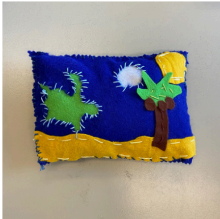
MOLA - PANAMA